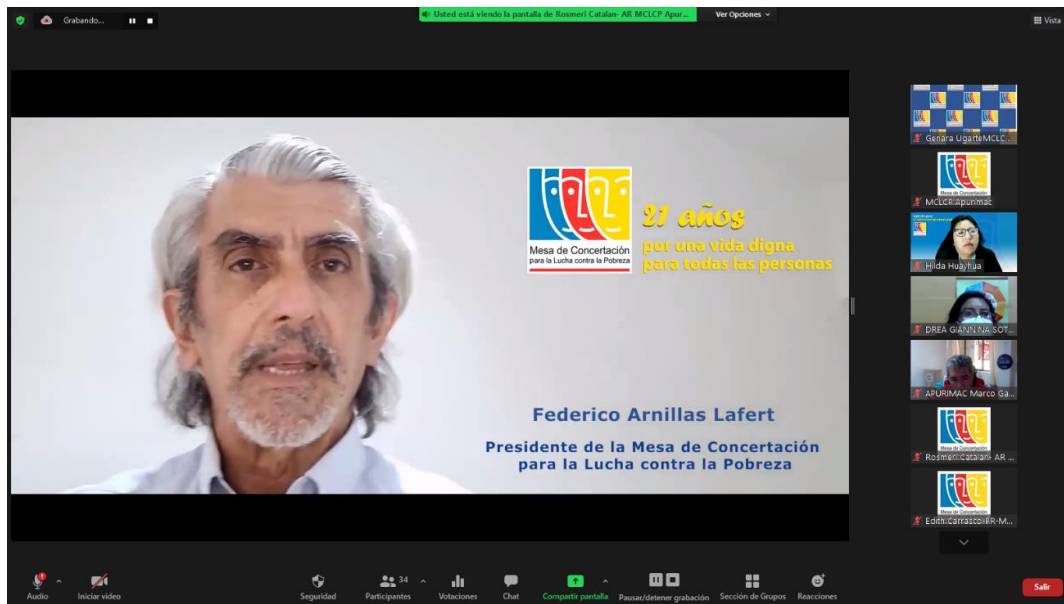
Video saludo por los 21 aniversarios de la MCLCP