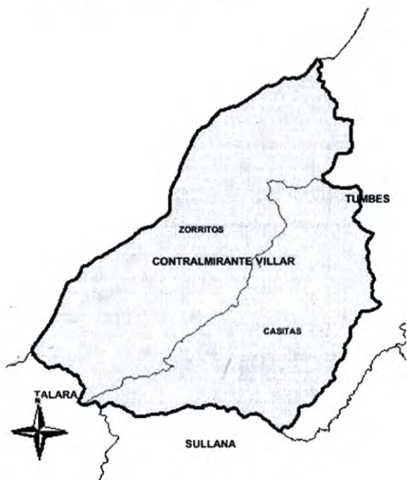
VISION DEL DISTRITO